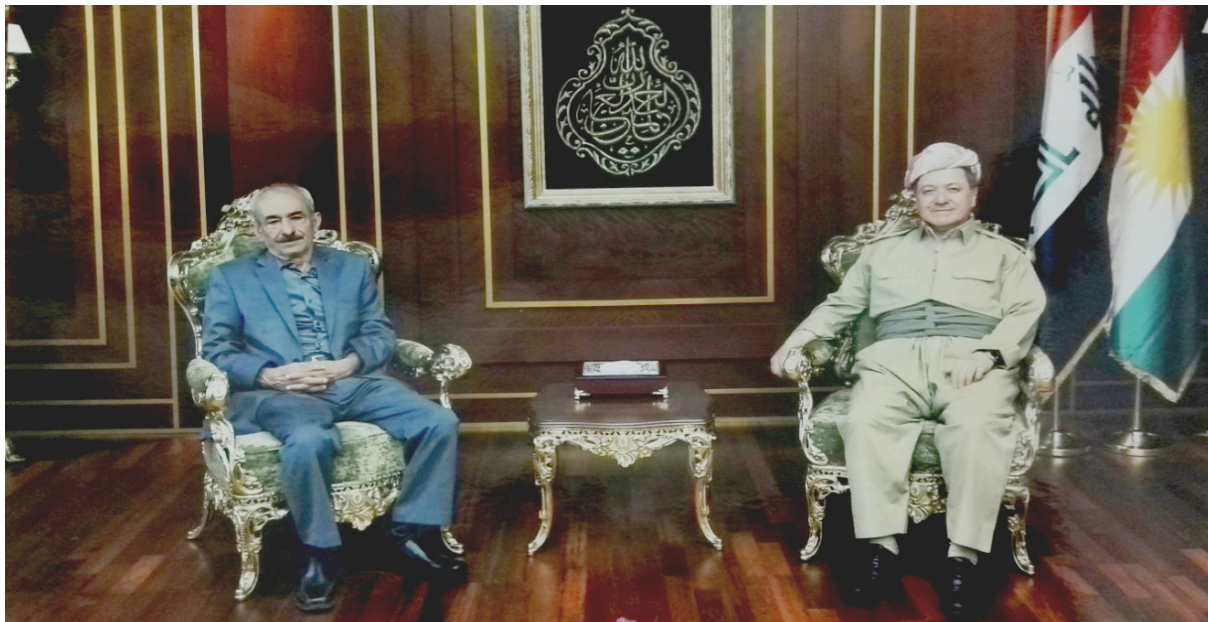
سەرۆک (مەسعوود بارزانی) و هەلبەستفان (بەنگینێ زێباری)